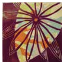
20 Regina Aigner