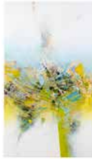
03 Elisa Parth