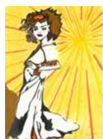
30A Bettina Pospichal