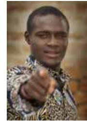
11 ART 3 GALERIE Tom Platzer