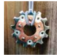
05 Ulrike Banny-Reiter