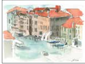
09 KLEINE GALERIE Albert Wimmer