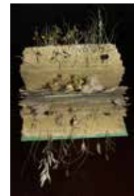
22 Beatrix Mapalagama