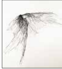
08 Helmut Weiländer