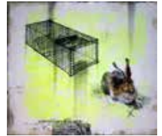
12 Viktors Svikis