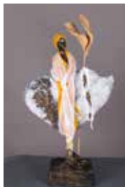
19 Vienna-Creativ- Atelier