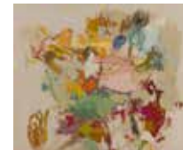
27 Britta Dion