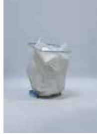
09 ATELIER HAMBURG Paul Wimmer