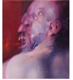
19 KLEINE GALERIE Lubomir Hnatovic