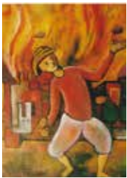
01 Herbert Bauer