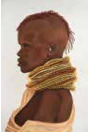
07 SHIATSU-ART Georg Koytek