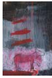
17 Uta Heinecke