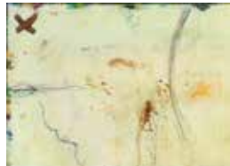
02 SALON MODENA ART Faek Rasul