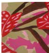
37 Regina Aigner