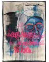
39 Anna Reschl