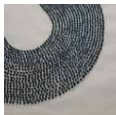
36 Nora Bachel