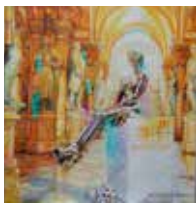
14 ARTLABOR Adalbert Wazek