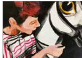
24 der MALORT Mischer-Werzowa