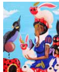
38 VIENNA-CREATIV-ATELIER Aliz Art