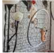
03 Saleh Rozati