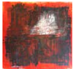
33 Jasna Glavicic-Deutsch