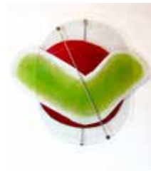
18 LOFT 8 Orsini-Rosenberg