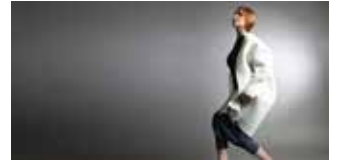
12 LINIERT clothing