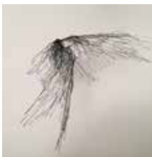
21 Helmut Weiländer