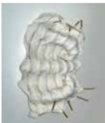
34 Beatrix Mapalagama