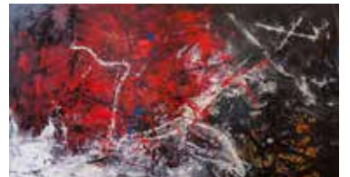
25 KUNST GALERIE - Kristof Brus