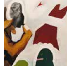
11 Tuncay Boztepe