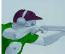
08 Ondrej Kohout