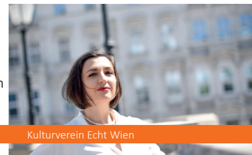
Kulturverein Echt Wien